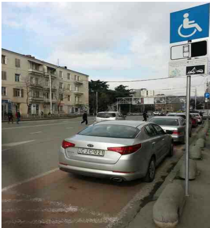
ფრაქცია „ევროპული საქართველო-თბილისის“ თავმჯდომარის, მამუკა ახვლედიანის სარგებლობაში არსებული ავტომობილი გაჩერებულია შშმ პირებისათვის განკუთვნილ ადგილას, 2015 წლის 18 მარტი, ოთხშაბათი, 10:35, შარტავას ქ., 7